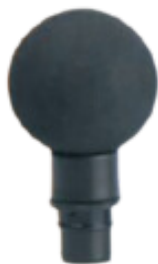
Końcówka okrągła stosowana do masowania większych grup mięśniowych