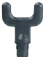
Końcówka w kształcie widelca stosowana jest do kręgosłupa