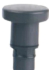
Końcówka płaska jest stosowana do kończyn i ramion