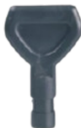
Końcówka w kształcie zatyczki odpowiednia do masowania wszystkich części ciała, w tym kręgosłupa